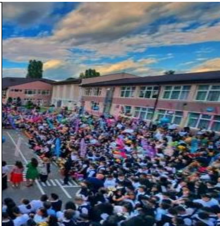
Comisia de evidență și gestionare a manualelor școlare Raport de activitate, an școlar 2021-2022

Activitatea comisiei începe în fiecare an cu procurarea, organizarea și distribuția manualelor școlare pentru toți elevii școlii. Pentru clasa I, achiziția manualelor școlare se realizează în conformitate cu efectivele